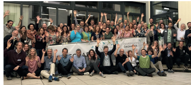
Internationale Delegiertenversammlung 2017 in Paris